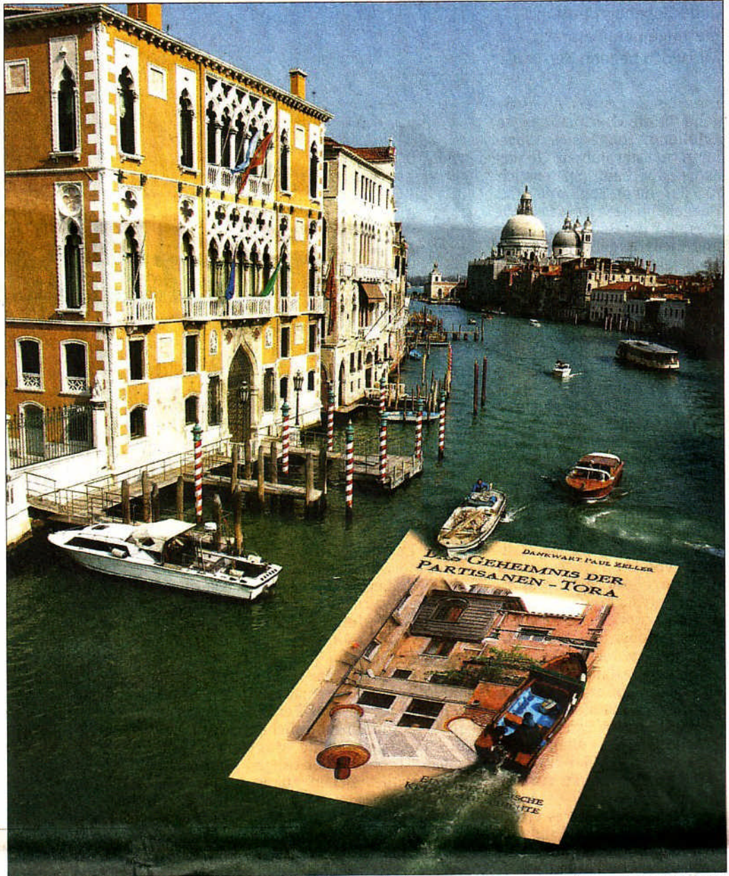
In Venedig beginnt die Geschichte, die im Mittelpunkt des ersten literarischen Salons in Onstmettingen stand und sich unter anderem auch um die Kirche Santa Maria della Salute (Kuppelbau hinten rechts) dreht.

steht: der Campo des Ghetto nuovo. Wie er die Geschichte weitergesponnen hat bis in die Zeit, in der die Städtepartnerschaft zwischen seiner Heimatstadt Tübingen und dem russischen Petrosawodsk begonnen hat, ist ein Meisterwerk. Und viel spannender, als das Thema es vermuten lässt. Die »Juden als Gottesmörder«, dieses noch immer haftende Menetekel haben selbst große Theologen wie einige Zuhörer wissen es – Martin Luther am Leben erhalten.